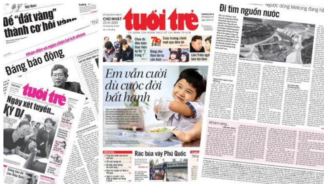
Интерфейс газет Tuoi Tre

что печатная пресса также занимает очень важное место в повседневной жизни вьетнамцев. Среди многих газет Tuoi Tre является престижной газетой, которой вьетнамцы доверяют и которую читают больше всего. Tuoi Tre также имеет чрезвычайно большое количество читателей с распространением публикаций по всей стране.