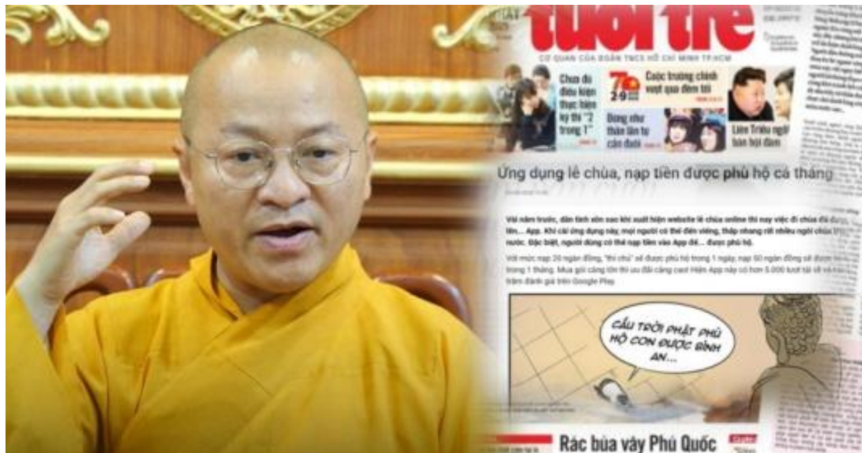
Газета Tuoi Tre высмеяла приложение «Буддист онлайн».

Будда на целый месяц» с карикатурой на Будду и буддийских последователей художника Качо (то есть Фан Хонг Дык).