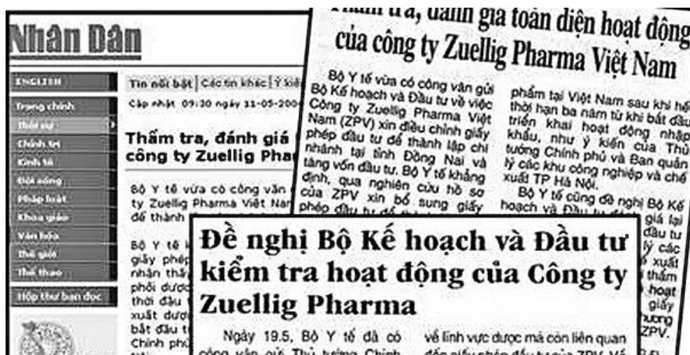
Статья «Рекомендация провести комплексную проверку компании Zuellig Pharma»

написал много статей о деятельности отрасли. 20 мая 2004 г. на 2-й странице газеты Tuoi Tre была опубликована короткая новость: «Предлагается провести всестороннюю проверку компании Zuellig Pharma», в которой упоминалось официальное послание министра здравоохранения Тран Тхи Трунг Чиена с просьбой к премьер-министру назначить министерство Планирования и инвестиций действовать в качестве координационного центра для координации с министерствами и ведомствами в организации, проверке и всестороннем изучении Zuellig Pharma Vietnam.